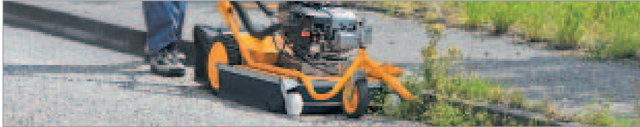
Praktisch und arbeitssparend: Reinigung der Bordsteinkanten mit der Wildkraut Hex AS 50.