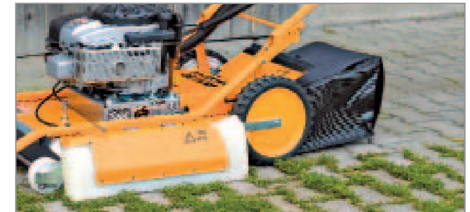
Schnell und effizient: Flächenreinigung mit der Wildkraut Hex AS 50.