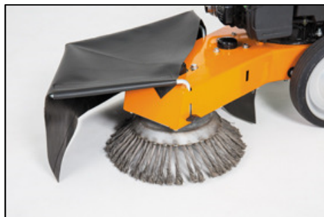
Bild 2: Kein aufgeschleudertes Material: Ein Schutztuch und eine Bürste ohne Zwischenräume sorgen für sicheres Arbeiten mit dem AS 30 WeedHex

Bild 1: Der AS 30 WeedHex ist speziell für unebene Flächen konstruiert und lässt sich gut auf Kopfsteinpflaster, entlang von Rinnen, in Ecken oder an Schächten einsetzen