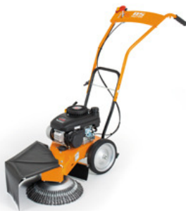
Bild 3: Der handliche und kompakte AS 30 WeedHex kommt Mitte 2017 auf den Markt

Bild 2: Kein aufgeschleudertes Material: Ein Schutztuch und eine Bürste ohne Zwischenräume sorgen für sicheres Arbeiten mit dem AS 30 WeedHex