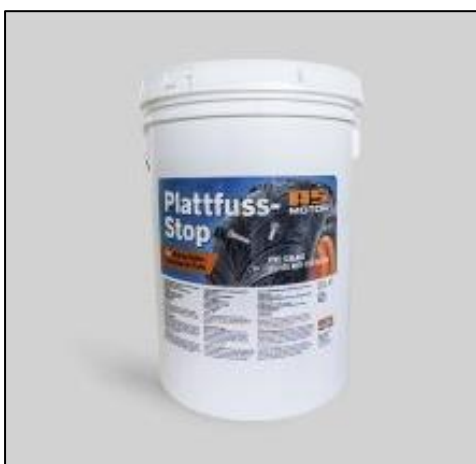
Bild 3: „Plattfuss-Stop“ gibt es auch im 20-Liter-Gebinde; es verklebt und klumpt nicht und ist unbegrenzt haltbar