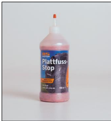
Bild 2: Die 950-ml-Flasche „Plattfuss-Stop“ reicht für den Hinterreifen eines Sherpa-Aufsitzmähers aus